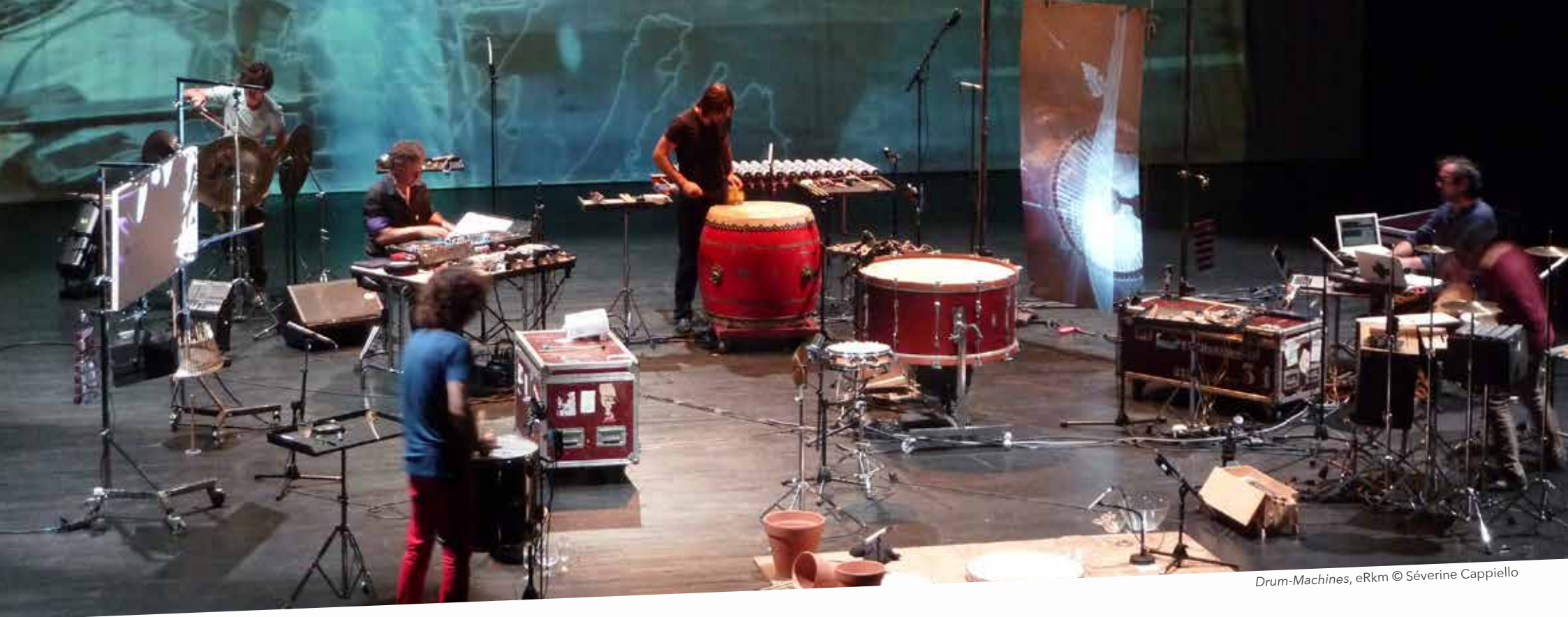
Drum-Machines, eRkm