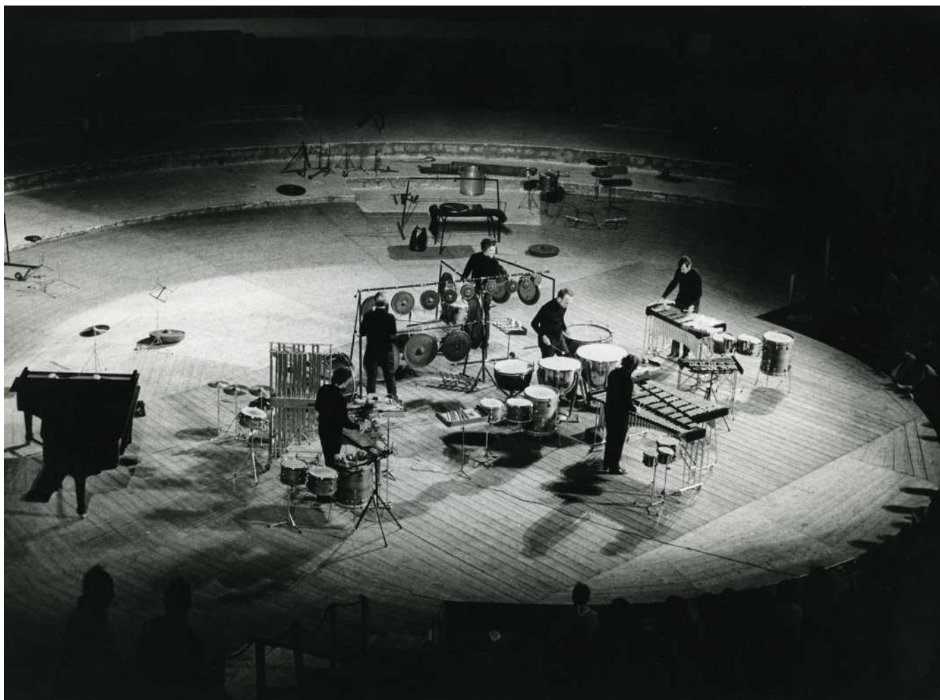
Centre culturel de Hammamet (Tunisie), août 1970. Au programme, les huit inventions de Kabeláč

Les Huit Inventions pour instruments à percussion, opus 45 (Corale, Giubiloso, Recitativo, Scherzo, Lamentoso, Danza, Aria, Diabolico) ont été écrites en 1962, à la demande des Percussions de Strasbourg. Dans cette composition culmine l'intérêt de l'auteur pour les instruments à percussion et pour la musique orientale qui s'est manifestée dans ses nombreuses œuvres précédentes. Chacune des Huit Inventions a son expression et son atmosphère propre, déterminée par le choix du matériel sonore et par son organisation. Miloslav Kabeláč modèle son contenu musical en épuisant toutes les possibilités de traitement non conventionnel de la mélodie, du rythme et du timbre des percussions.