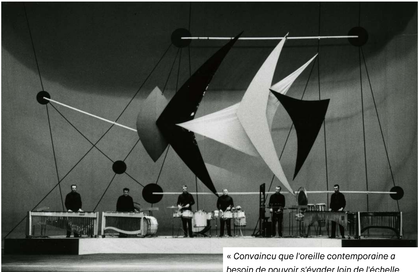
Première des « Quatre études chorégraphiques » de Maurice Ohana au festival de Strasbourg, 1965